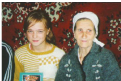
Her sitter bestemor med sitt barnebarn. Disse har vært interesserte i å studere bibelen i to år allerede. Disse bor i meget fattige kår. Menigheten har hjulpet disse økonomisk med penger fra KRL.