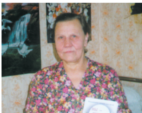
Denne damen leser våre bøker med stor interesse. Hun låner også bøker til sitt barnebarn.