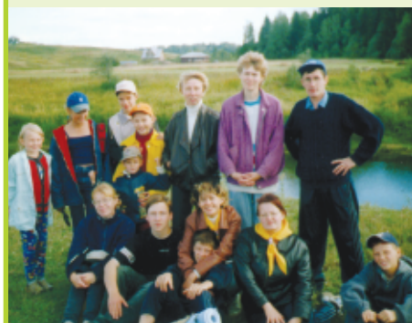
Hilsen fra alle speiderne i Vologda