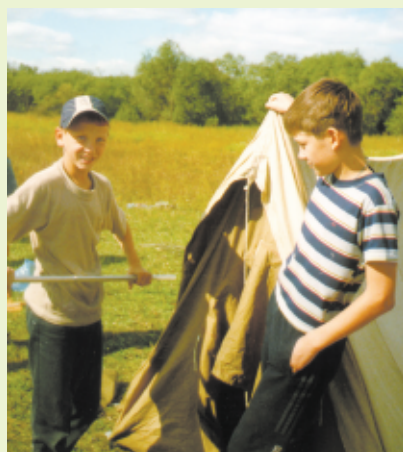
Hvordan fungerer dette egentlig?

Desverre har våre kjære venner i Vologda ikke noen e-post-adresse enda. Engelskkunnskapene er det også dårlig med. Men til tross for dette, er du interessert i å ta kontakt, så ring meg (32 75 67 75) og jeg vil sende deg den russiske adressen. ○