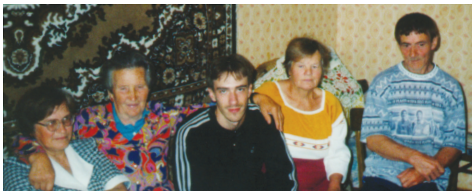
Mannen til høyre kjemper med å slutte og røyke, men ønsker å ta dåp så fort som mulig. Hans kone, helt til venstre med briller, er også klar til å bli døpt. Her i hjemmet deres samles en liten gruppe hver sabbat.

Jeg vil på det varmeste takke alle i Norge som har gitt penger til alle bøkene som vi har fått. Vi vil sende en oppriktig takk til alle søsken i Norge. Må Gud være med dere. Takk for all oppmuntring og konkret hjelp til oss, så vi kan være aktive i Guds arbeid." ○