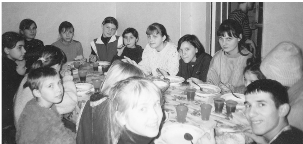
Barna og de unge under et kjærlighetsmåltid.

Tiden går og det er en stund siden du hørte fra oss. Også i år har jeg spilt inn en kassett med erfaringer fra reisen i Russland i mai i år. Er du interessert i å få den tilsendt så ring 32 75 67 75. Vi vil på det varmeste takke deg for dine gaver. Mange av de menneskene vi møtte i Russland er utrolig takknemlige for at vi bryr oss om dem og ikke minst for å få hjelp med bøker og annet de trenger. Vennligst ta imot deres takk!