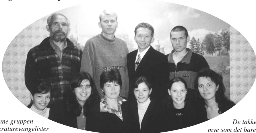
Denne gruppen litteraturevangelister bor i Magadan, langt øst i Russland. KRL har sendt en hel kontainer med litteratur dit.

KRL vil takke alle dere givere for alle gaver, både små og store!!!