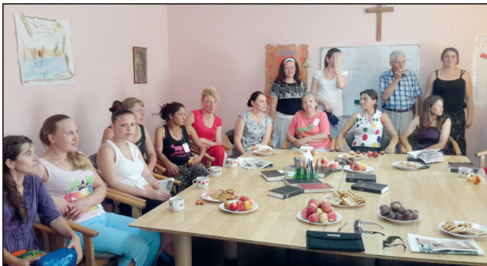
Den 15 år gamle jenta sitter som nummer tre fra venstre.

allerede støttet noen av disse tidligere innsatte som er blitt omvendt.