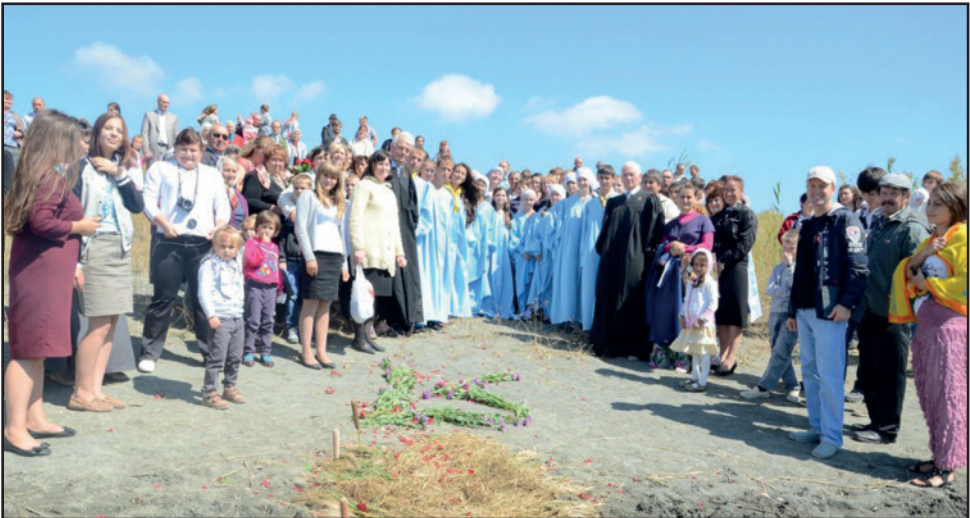
De 10 dåpskandidatene med menigheten er nå samlet like før selve dåpshandlingen 10. september i år.

mennesker for Guds fantastiske rike. De 3 siste årene har vi bodd og jobbet i en by som heter Etoke, ca. 100 km fra Georgia. I menigheten er det mange aktive misjonærer. Under mitt første år her begynte vi et prosjekt med å dele ut bøker, bl.a. "Mot historiens klimaks" og "Bare Allah kan gi sann fred". Siden den gang har vi gitt bort hele 1.400 bøker både her vi bor og i sju andre nærliggende tettsteder. I det siste har vi tatt beslutningen om å utvide bokdistribusjonen til et sterkt