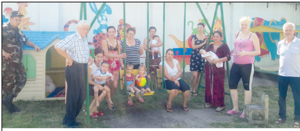
Her er en gruppe mødre med sine barn.

Tidlig en sabbats morgen da vi fortsatt var i Chisinau, Moldovas hovedstad, gikk vi et tur langs byens hovedgate. Sakte men sikkert hørte vi lyden av musikk. Vi ble nysgjerrige og fant til slutt ut at lyden kom fra en ortodoks kirke. Ja, det var ikke vanskelig å gjette. Folk nesten løp for å komme seg fortest mulig inn. Denne dagen var nemlig en spesiell helligdag