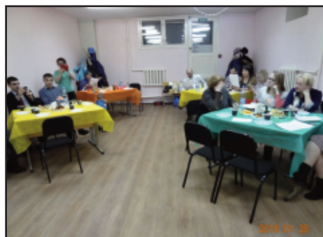
Festmålid sammen med besøkende.