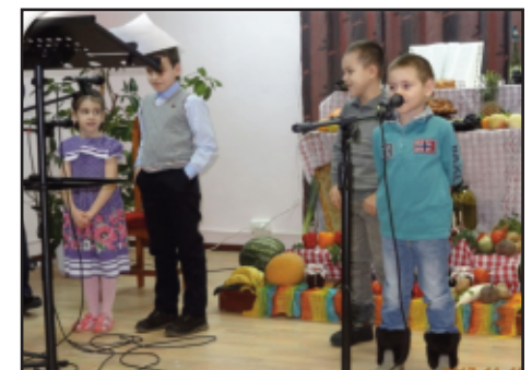
Barna ville selvfølgelig også synge.