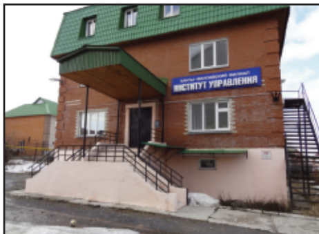
Slik ser bygningen ut.