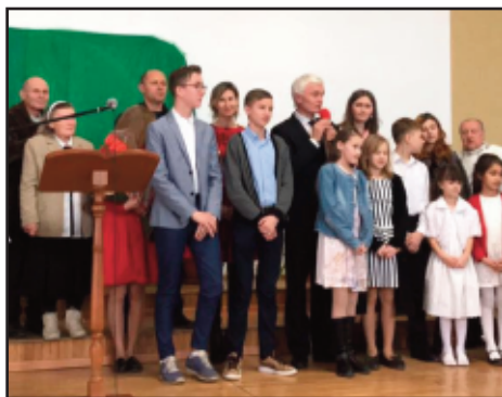
Her er de 12 som kom frem etter apellen.