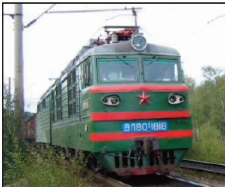
Typisk russisk tog.

I midten av desember 2017, følte jeg meg frustrert i mitt arbeid som pastor. Det er sant at Gud virkelig har velsignet meg i mitt arbeid og alt det store som har skjedd i menighetene. Fattige har ikke blitt glemt. Ensomme har fått besøk. Men likevel, jeg følte at det manglet noe. Hadde jeg oversett noe Gud ville vise meg? Jeg begynte å be intenst til Gud om han ville vise meg hva jeg eventuelt hadde gått glipp av, og at Han skulle handle gjennom meg etter sin vilje. Slike bønner tror jeg Gud vil svare på. Nå kan jeg bare takke, hans kjærlighet viste meg at i forrige måned hadde jeg ikke med meg kristne bøker til å dele ut til folk som Herren sende i