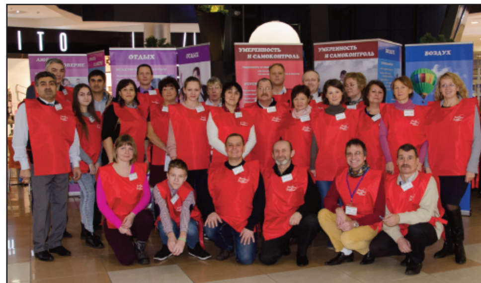
Hele staben samlet til innsats for byens beste.

spurte etter fakta. Personlig har jeg konkludert med at mange skjønner at helse er en dyrebar gave som må beskyttes. Folk begynner å innse at å ødelegge sin helse med all slags avhengighet og mangel på måtehold bringer lidelser. Ikke bare til seg selv, men også til sine