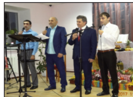
Mannskvartett under høstfestivalen 2017.