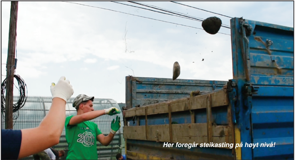
Her foregår steilkasting på høyt nivå!

kontakter. I dag bestemte jeg meg for å gjøre "noe spesielt". Ved inngangen til landsbyen står det et stort skilt som kalles "Stella". Malingen var flasket av på mange steder, og jeg bestemte meg derfor for å male hele skiltet. Jeg fikk bare lyst til å gjøre noe for bygda vår, på en eller annen måte! Det tiltaket ble virkelig vellykket!!