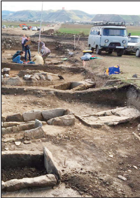
Her er utgravingsstedet i Cherkesk.