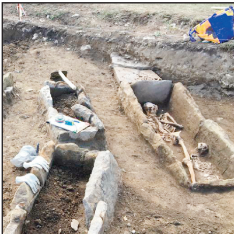
Her var det visst spennende ting.