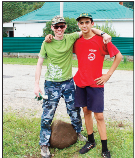
To glade steinkasterkompiser!!

2 JA og ble med meg. Jeg takket disse to, og mens vi gikk mot det nye området hørte jeg overraskende en som gråt og sa: "Pastor vent, jeg vil også bli med." Da jeg snudde meg, så jeg et enda mer overraskende syn. Ikke bare én gutt som gråtende kom løpende og hadde ombestemt seg, men hele guttegjengen