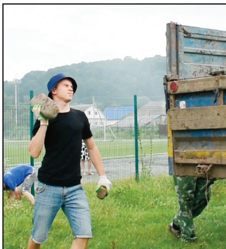
Tunge løft og atter tunge løft ...

To dager senere stoppet jeg bilen ved de gamle utgravningene som finner sted i nabobygden Cherkesk. Der så jeg en muslimsk familie. Mannen i turban, en åndelige lærer, en mulla fra moskéen, og hans kone i hijab. Jeg gikk bort til ham og startet samtalen omtrent slik: "Tror du at alle disse beinene kommer til live?" "Ja, selvfølgelig", ropte begge samtidig, "alle skal stå opp fra graven på dommens dag!" Ja, det er sant sa jeg og vi var helt enige om det. Etter en veldig interessant samtale begynte han å overtale meg til å bli en ekte muslim. Jeg på min side ønsket at han kunne bli kristen. Samtalen var ikke lett. Men da jeg begynte å snakke om Hvem jeg tror på og hvorfor, ble han overrasket over