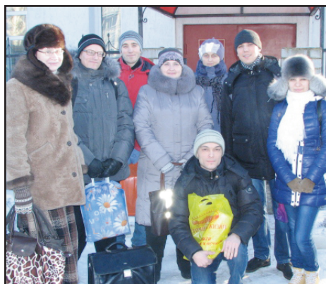
Klare til å gå fra dør til dør i februar-kulden.