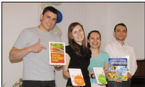
Fire glade teologistudenter er medhjelpere.

Etter at Volodya og Nikolai hadde besøkt flere hus og fått avslag, ble de endelig invitert inn i en leilighet. Dette er deres egne ord: "En kvinne inviterte oss til en kopp te og samtidig snakket vi om