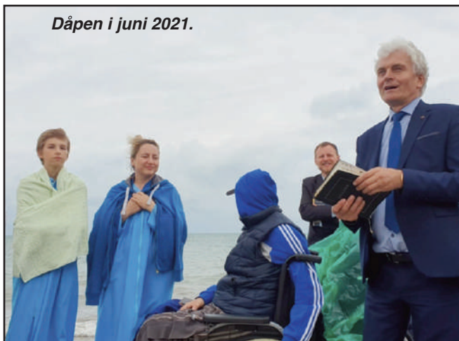
Dåpen i juni 2021.

Så fikk hun tilbud om å reise nettopp til adventistsanatoriet i Abkhasia som heter "Hjem på landet". Der har de 10-dagers gjesteperioder. Under disse dagene ble hun kjent med bibelstudiene som heter "Så sier Bibelen". Dette ville hun gjerne studere. Hun trivdes så bra