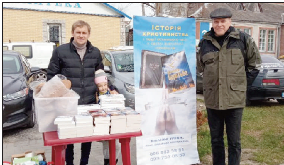
Bokutdeling på gata i Kharkov.

vår allmechtige Gud ville bringe bøkene våre bort og ut fra krigen i Kharkov. Vi begynte også å lete etter trykkerier hvor vi kunne fortsette å trykke flere bøker, siden behovet var og er så stort. Etter å ha ringt mange trykkerier, ble jeg møtt med det faktum at de enten hadde stoppet sin virksomhet eller ikke kunne trykke noe som helst på grunn av papirmangel. Som et resultat av krigen, har tilførselen av papir fra Russland og Hviterussland stoppet opp. Og dette problemet løste Gud mirakuløst. Ære til Ham! Vi fant et trykkeri, som nettopp bestemte seg for å gå tilbake til produksjonen og gikk med på å lete etter papir for å trykke bøker. Vi ba og Herren