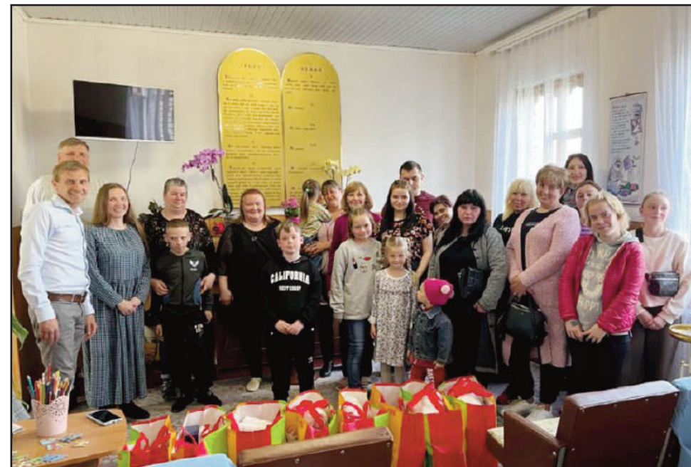
Menighetsfamilien og besøkende sammen med bæreposer med hjelp til folk i krise.

sendte dem papir til et opplag på 10.000. Vi var meget klar over at prisen hadde blitt betydelig høyere nå enn tidligere. Men det var fortsatt mye billigere enn å trykke i Vest-Europa. Mens dette opplaget ble trykket, sendte Herren mer papir til 12.000 bøker til. Trykkeriet fant i tillegg papir fra andre papirleverandører til et opplag på ytterligere 13.000 bøker. Vi ble spurt av trykkeriet om vi var interessert i å få trykket opp 13.000 bøker i tillegg. Siden vi ikke hadde penger til det, ba vi trykkeriet om å reservere papiret fordi vi trengte tid for å gi et svar. Så begynte vi å be. Vi beskrev situasjonen for bønnegrupper i flere menigheter og ba dem om å støtte oss med kraftig bønn om økonomisk støtte. Og takk til Gud, han løste dette problemet. Nå er det tredje opplaget av boken i trykk. Totalt har 35.000 bøker