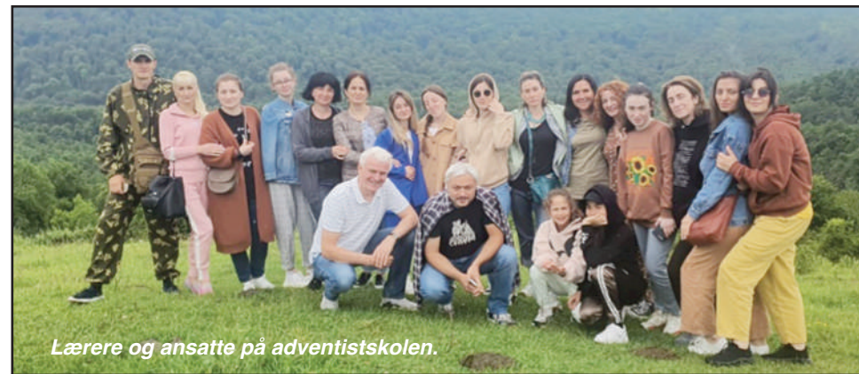
Lærere og ansatte på adventistskolen.

Vi har en adventistskole her i byen, Alle lærere og ansatte er ikke adventister ennå, men hver morgen samles vi først til en andakt. Alle kommer for å lytte til Ordet om Kristus. Lærer-staben har nylig vært på besøk til det lille adventistsanatoriet som heter "Hjem på landet". For oss ble dette et "gjennombrudd", at hele staben kunne ta denne studieturen til helsehjemmet. Da vi ankom ble vi ønsket hjertelig velkommen. Vi spiste sammen, og det ble anledning til å stille spørsmål. Dette utviklet seg til en fin atmosfære. Vi sang, leste Guds ord og ba sammen. De fleste av lærerne er abkhasere, de er stort sett ortodokse men kjenner ikke Jesus. Ansatte ved sanatoriet holdt foredrag om de 8 helsenøkklene. Lærerne var svært takknemlige for denne studiedagen, både til skoleadministrasjonen og arbeiderne på helse-sanatoriet. Takk til alle for bønnene deres. Tusen takk!