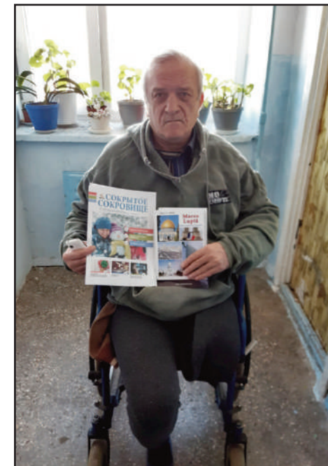
Mannen i 5. etasje.