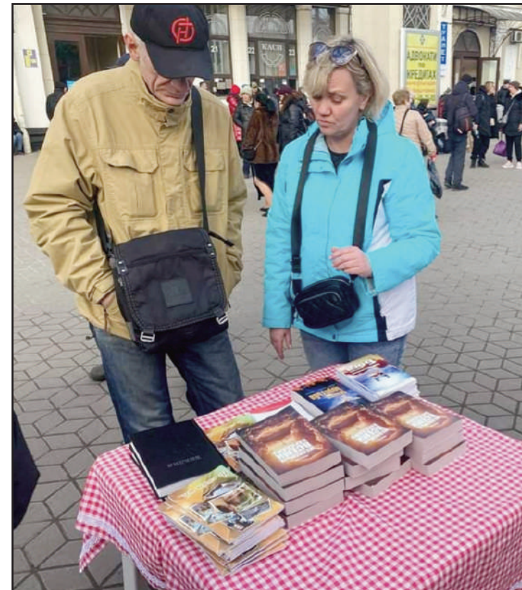
Bokutdeling på togstasjonen i byen Odessa.