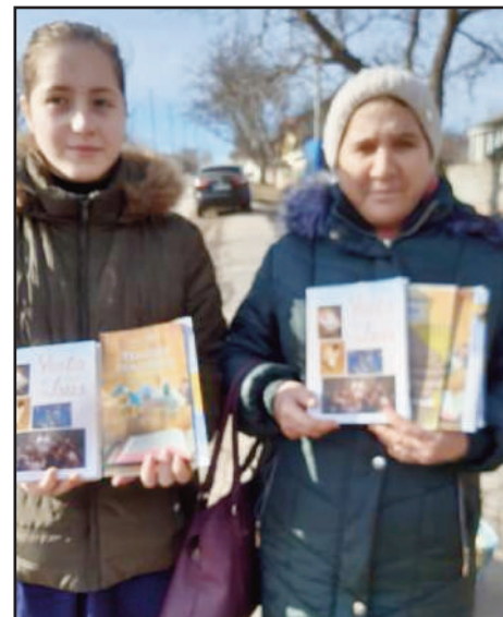
To glade evangelister.