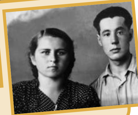
Mange gode minner!!

bestemte jeg meg for også å gi denne boken til rådhusets ledere og deres stab. Vi så ikke en av lederne personlig, men snakket med dem på telefon. En dame jeg kontaktet der spurte hva jeg ellers gjorde, viste det seg at hun, i likhet med meg, tenkte å åpne et senter for sosialhjelp til befolkningen i form av gratis klær, sko og andre ting. Faktum er at i august hadde jeg ikke nok ressurser og forbindelser, men nå er alt annerledes. Takket være utdeling av boken Mot Historiens Klimaks og Hvert Hjem-prosjekt har jeg funnet mange venner. Til i dag har vi hatt nok midler til