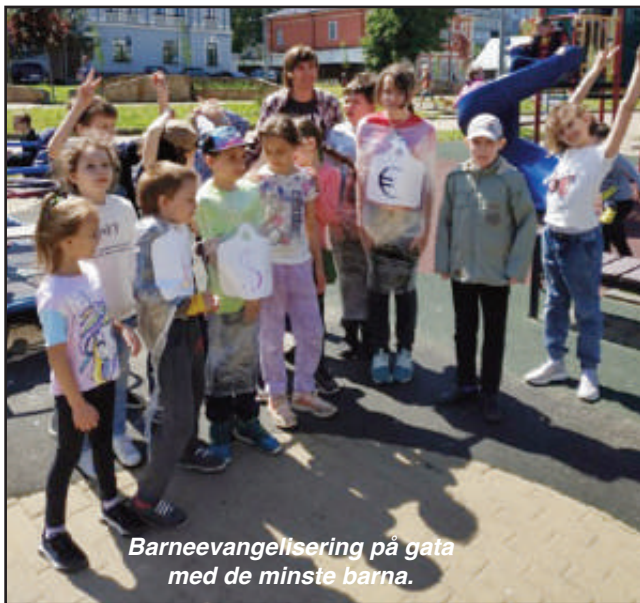
Barneevangelisering på gata med de minste barna.