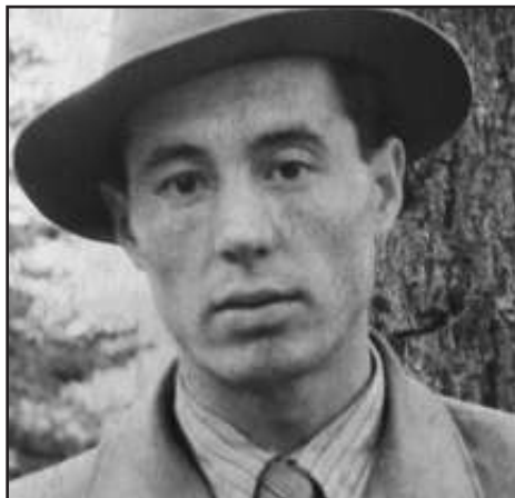
Faren min som ung og sterk i troen.

å stille rare spørsmål. Det hele virket så merkelig. Siden faren min ikke skjønnte hva de egentlig ville, inviterte han dem inn i huset. Det viste seg at disse menneskene, akkurat som min far, var vanlige mennesker i et land der alle skulle være ateister. Men saken var at disse menneskene tenkte selvstendig