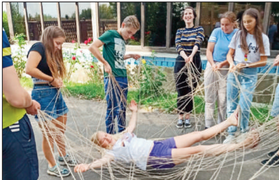
Lekende gøy på mellom- og ungdomstrinnet.

I år kom det barn som hadde mistet foreldrene sine til vår skole. Etter å ha