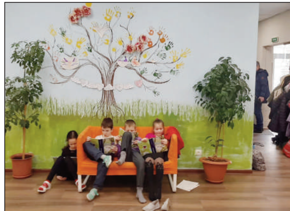
Det skal mye til for ikke å trives i et så hyggelig skolemiljø.

vært på den vanlige skolen begynte resultatene å synke og disiplinen ble bare dårligere. Etter å ha byttet til vår skole, har barna tilpasset seg miljøet her, og resultatene og disiplinen bare stiger. Det er en glede for meg å kunne jobbe med disse barna. I menighetens regi har vi laget en eventyrklubb for å kunne invitere sekulære skolebarn til menigheten. Kona mi er leder både i barneavdelingen og i musikkavdelingen i kirka.