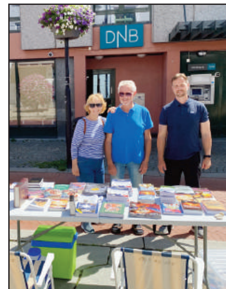
Bokbordet som Impactgruppen hadde på torget i Kongsberg.