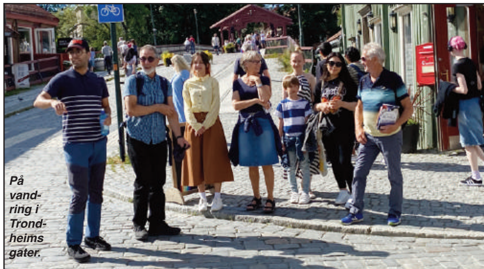
På vandring i Trondheims gater.

også en stor opplevelse der vi sto sammen med menigheten og ADRA, og opplevde mange spennende treff med søkende mennesker. En stor takk til Gunn og Per for at vi fikk være hos dem og samarbeide med dem og menigheten om utdeling av mange bøker. Sommeren ble hektisk og spennende. All takk til Gud! ❖