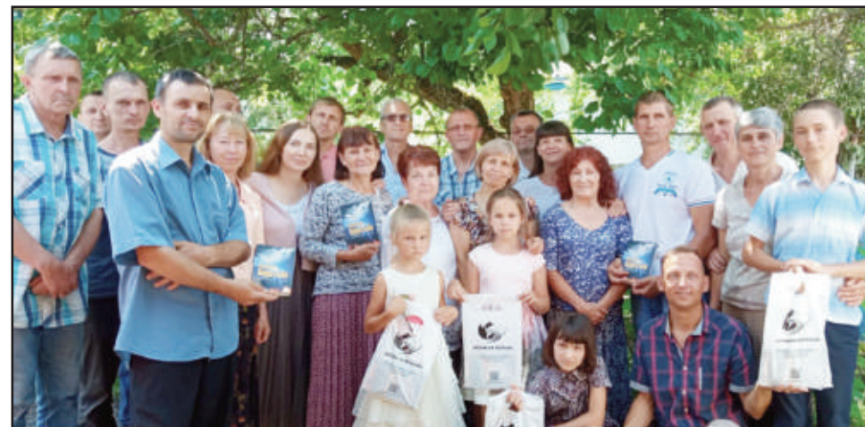
Hele 24-mannsgruppen klare til misjons-aksjon.