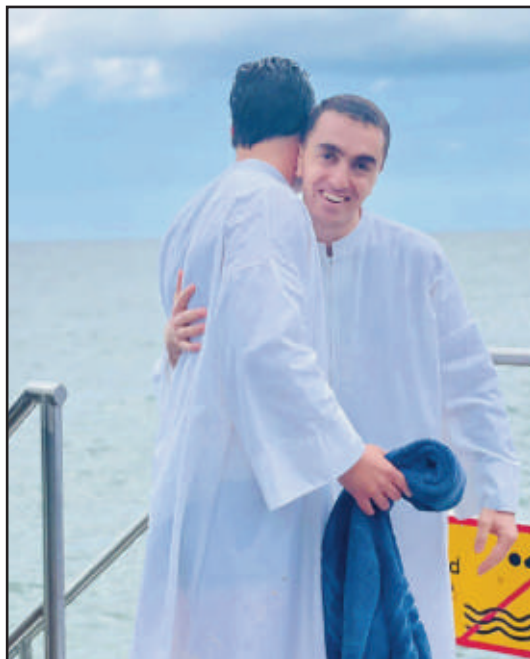
Like før dåpen i det kalde vannet.

Her kan du se mer fra sommerens besøk i Armenia: https://www.youtube.com/watch?v=-jrJJinjuKZM