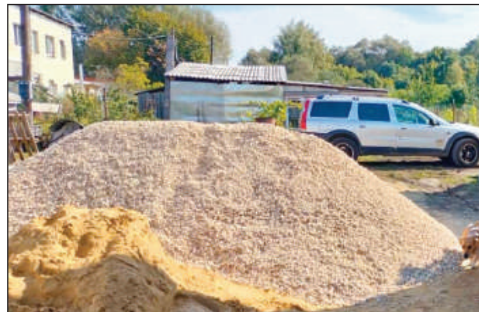
8 tonn grus som kom i riktig "time".

Nå er vi tomme for barnebøker igjen, men vi drømmer virkelig om å kunne