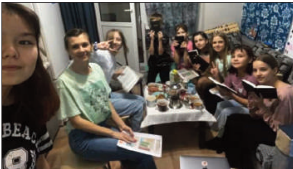
Mariannas trofaste medhjelpere.