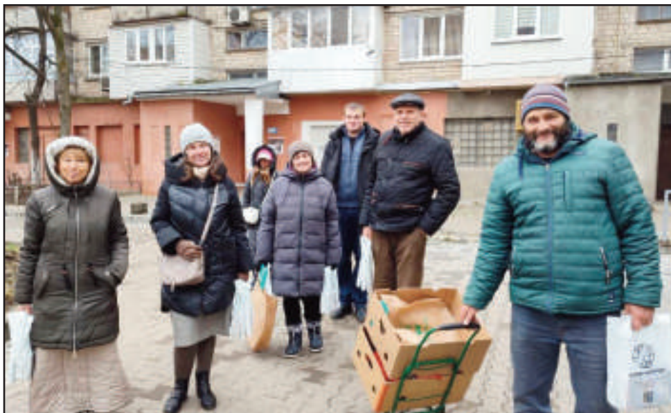
Utdeling med glede.

Striden). Til dags dato, har boken blitt trykt i 370.000 eksemplarer. Nesten alle er allerede distribuert og vi samler inn penger til å trykke flere. Vi er 14 misjonsgrupper her i Ukraina som samarbeider om dette. Boken DSS har til nå blitt distribuert til hvert hjem i 250 landsbyer og 21 byer. Prosessen med innsamling, trykking og distribusjon pågår samtidig. Vårt mål er, og vi ber om at boken DSS vil nå alle hjem i Ukraina og alle hjem i alle land i verden. Herren gir mange opplevelser mens vi jobber med dette. Vi ser at boken har innflytelse på