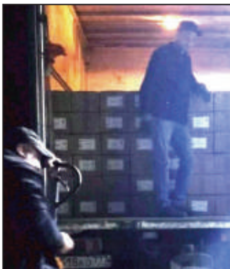
To bilder fra den dagen vi mottok de 23.000 biblene.

Den 20. september sendte vi rundt 30 sett med barnebøker og bibler til en internatskole for funksjonshemmede i Moskva. Barna der vil med disse gavene få en sjanse til å lære at Herren er kjærlighet og en hjelper i vanskeligheter. Vennligst be for alle barna som mottar disse bøkene. Vi samarbeider med mange skoler og rehabiliteringssentre. Vi sender oftest