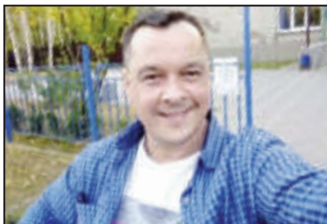
Fornøyd mann som mottat en bokpakke.

bestille nytt opptrykk. Det er jo så veldig viktig å kunne evangelisere også for barn.