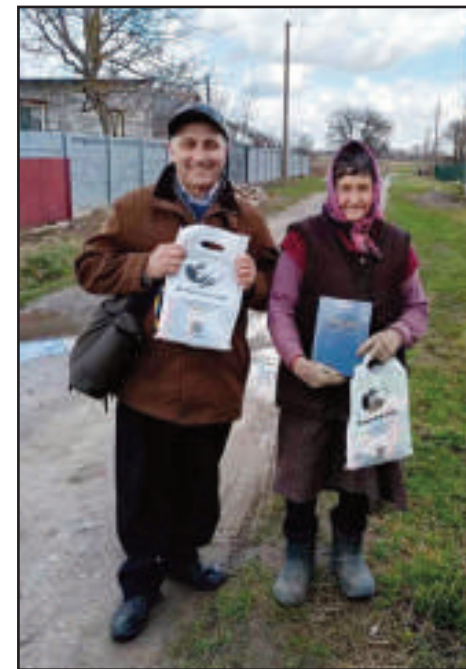
... og mer utdelingsglede.

mange av hennes forskjellige bøker. Nå leser han dem der hjemme med glede. Han er så "takknemlig for å ha funnet venner som også liker hennes bøker", som han selv sier. Han fortsetter å gå til sine baptistvenner på søndager, men med denne hensikt: å fortelle hva Ellen White sier om denne eller den saken. Takk Gud!